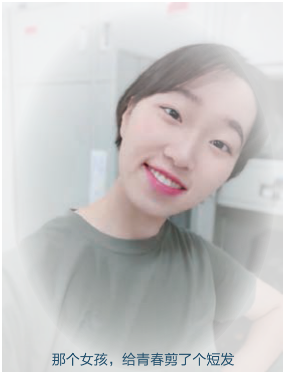
那个女孩，给青春剪了个短发